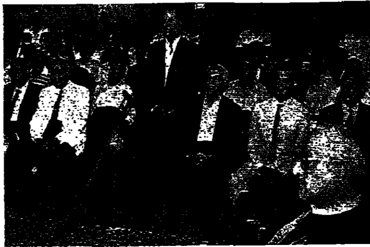
الحضور في القداس